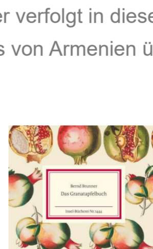
Bernd Brunner Das Granatapfelbuch Fester Einband 15,00 Euro

Und natürlich finden Sie eine Vielfalt schöner Dinge, zum Beispiel alle „kleinen gourmandisen“ des Mandelbaum-Verlags, feine Adressbücher und Notizbücher, italienische Briefmappen, Bleistifte, Füller von Kaweco, farbige Tinten, edle geprägte Weihnachtskarten und eines der schönsten Geschenkpapiersortimente in ganz Tübingen.