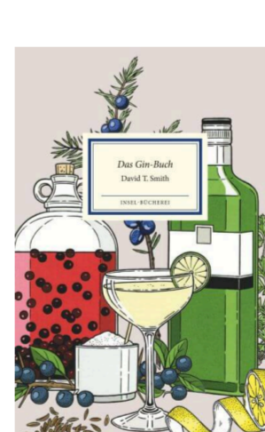
David T. Smith Das Gin-Buch Alles Wissenswerte von Gin & Tonic bis Wacholder Fester Einband 16,00 Euro

Der Liebhaber findet hier ein ABC des Gin, ein Handbuch, das alles Wissenswerte vermittelt, für den gelegentlichen Gin-Genießer ebenso wie für echte Gin-Nerds. Ob Bombay Sapphire, Hendrick's oder Tanqueray; Negroni, Singapore Sling oder der klassische G & T: David T. Smith nimmt uns mit auf eine Reise durch die aufregende Geschichte der Kultspirituose, erklärt die unterschiedlichen Herstellungsmethoden, was die besten Botanicals sind, und garniert das Ganze mit klassischen Cocktailrezepten.