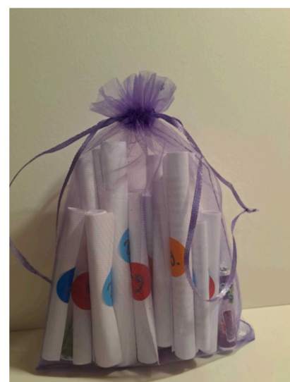
Lyrischer Adventskalender für Kinder 29,50 Euro

Und dann ist Weihnachten! Weihnachten ist die Zeit des Nachhausekommens, des Zusammenseins – und des Vorlesens. Und auch für diese festliche und stille Zeit möchte ich Ihnen ein sehr besonderes Buch ans Herz legen. Das Weihnachtsbuch aus der Reihe „die Andere Bibliothek“. Dieses Buch ist ein prachtvolles Geschenk und Lesebuch zum Verschenken oder auch für einen selbst: Eine gewaltige Fülle von Literatur zum Thema Weihnachten, ein Wegweiser zu den poetischen Schätzen in allen Epochen – Geschichten und Gedichte, Lieder und Legenden, Erzählungen, Sagen und Schlüsselpassagen aus Novellen und Romanen. Statt wahllos zusammengefügt, präsentiert „Das Weihnachtsbuch“ die Historie der Weihnacht sowie der dazugehörigen Geschichten in einer eindrucksvollen Sammlung. Anonyme, unbekannte Autoren treten neben berühmte Namen. Das Weihnachtsbuch schlägt in seinem Aufbau einen Bogen von den Spuren germanisch-heidnischer Rauhächte mit ihren Bräuchen zur Feier der Wintersonnenwende und der vorchristlichen römischen Tradition über die mittelalterlichen Legenden – bis ins 20. Jahrhundert.