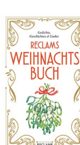
Weihnachtsbuch im Reclam-Verlag Gedichte, Geschichten und Lieder Hrsg. von Stephan Koranyi Broschur mit Goldfolienprägung 14,00 Euro

Und auch dies Büchlein umkreist diese besondere Zeit: