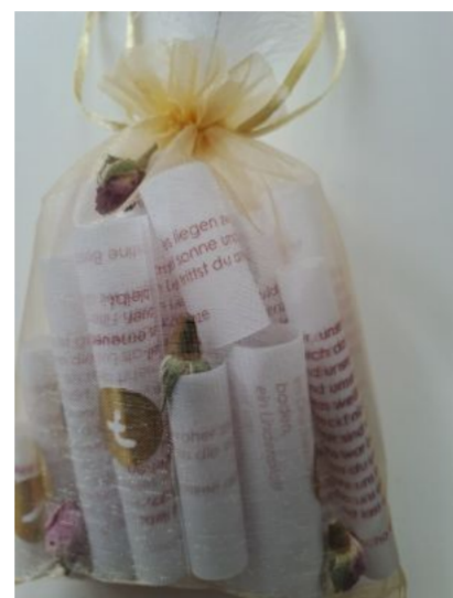
Lyrischer Adventskalender Für Erwachsene 29,50 Euro

Inzwischen habe ich zahlreiche Vorbestellungen für diese Adventskalender, da ich zeitlich doch nicht unbegrenzt nachproduzieren kann. Deshalb seien Sie schnell, wenn Sie welche für sich selbst oder Freunde erwerben wollen.