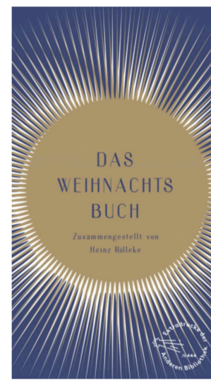
Das Weihnachtsbuch Zusammengestellt von Heinz Röhlke 26,00 Euro

Etwas weniger umfangreich, doch wunderschön gestaltet ist das